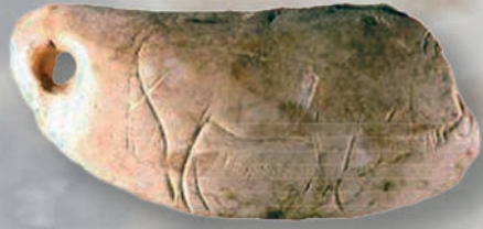
Fragmento de diente de cachalote ( Physeter macrocephalus ) Perforado, decorado con bisonte y cetáceo en relieve y ángulos grabados. Magdaleniense. Cueva de Las Caldas (Asturias). Museo Arqueológico de Asturias (Oviedo).