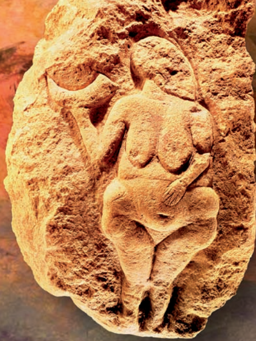
Ilustración de Arturo Asensio, según versión de Enrique Baquedano.