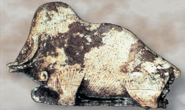
Extremidad distal de propulsor esculpido en forma de mamut Magdaleniense Medio. Cueva de Cancaude, Villardonnel, Aude (Francia).

No debe darse al olvido en estos balbuceantes pasos del descubrimiento de nuestra ciencia, al ubicuo Abate Henri Breuil que tantos importantes hallazgos realizó no sólo en la Península Ibérica, sino en otros lugares del mundo y, por supuesto, a todos aquellos innumerables investigadores que posteriormente han enriquecido con sus trabajos nuestro conocimiento.